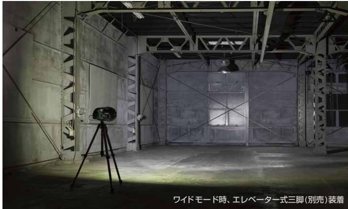
ワイドモード時、エレベーター式三脚(別売)装着