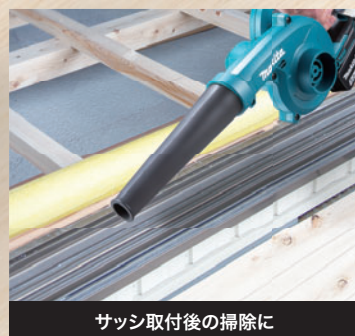
サッシ取付後の掃除に