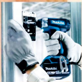
器具の取り付けに